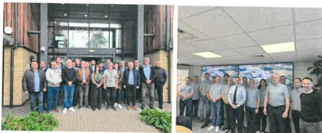
A társulás képviselői a Sizewell településen és az épülő erőműnél

zéró emisszió elérése érdekében a tervezett száz autóbusból hatvan hidrogénhajtású, negyven pedig elektromos busz lesz. A Sizewell C társaság a kormánnyal kötött megállapodás értelmében nagyszabású infrastruktúrafejlesztést hajtott végre saját költségén. A polgármesterek a szóbeli tájékoztatót követően autóbuszos látogatást tettek a beruházás területén.