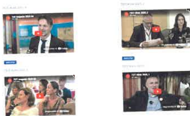
TEIT video hírek 4 videoja ( www.teit.hu )