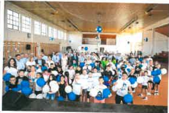
A 2025. szeptember 12-i TEIT Nap képei