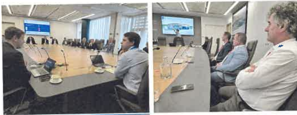
A társulás tagjai Londonban a Rolls Royce székhelyén

a munkálatokkal. A Temelin atomerőmű melletti helyszínen 6 GW kapacitású RR SMR technológiát terveznek megépíteni. A szerződést várhatóan még idén megkötik. Terveik szerint az első RR SMR-t Nagy-Britanniában fogják beüzemelni. Magyarországgal is kapcsolatba léptek: 2025. szeptember 23-án szándéknyilatkozatot írtak alá a Hunatom Zrt.-vel a brit kis modulárisreaktor-technológia lehetséges magyarországi alkalmazhatóságáról. A RR SMR egy nyomottvízes, 470 MW villamos teljesítményű reaktortípus.