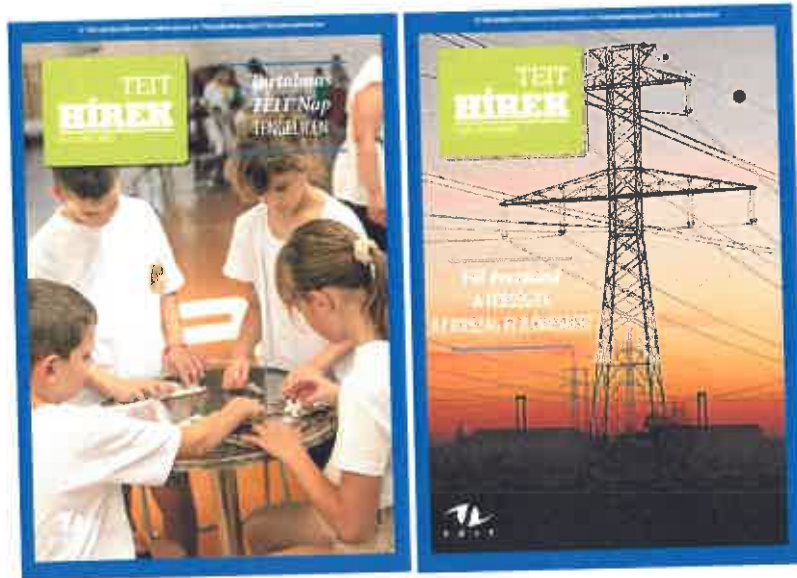
A TEIT Hírek 5 lapszámának címlapja