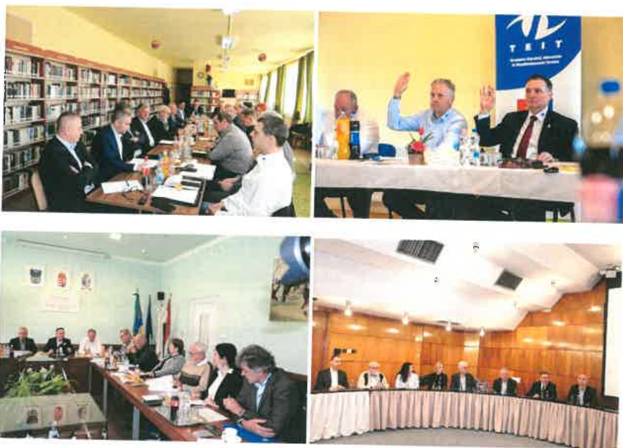
A társulás tagjai 2025. február 11-én Bátyán, 2025. május 29-én Pusztahencsén, 2025. október 30-án Uszódon, valamint 2025. november 27-én Pakson

A TEIT a 2025-ben rendszeres találkozók, üléseken aktualizálta tevékenységét, öt társulási ülést tartottunk, az üléseken a kötelező társulási költségvetési tárgyú előterjesztések mellett az éves médiatámogatások is konszenzussal elfogadásra kerültek. Az ülések témája volt még a TEIT 2025. évi munkaterve, valamint annak végrehajtásához kapcsolódó feladatok. Az ülések jegyzőkönyvvezetését a Kalocsai Polgármesteri Hivatal köztisztviselője látta el, mint a székhely települése munkaszervezeti feladata.