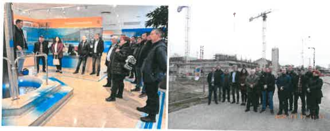
Az ellenőrző csoport tagjai 2025. november 17-én az atomerőműben

A második látogatás során az MVM Paksi Atomerőmű Zrt. telephelyén tekintette meg a csoport az üzemelő erőművet, valamint az építés alatt álló tűzoltó laktanyát. A csoport tagjai a vezénylőterem és turbinacsarnok megtekintése után a látogatói folyósóról a megkezdett 3. blokki főjavítás aktuális munkálatait ismerhették meg.