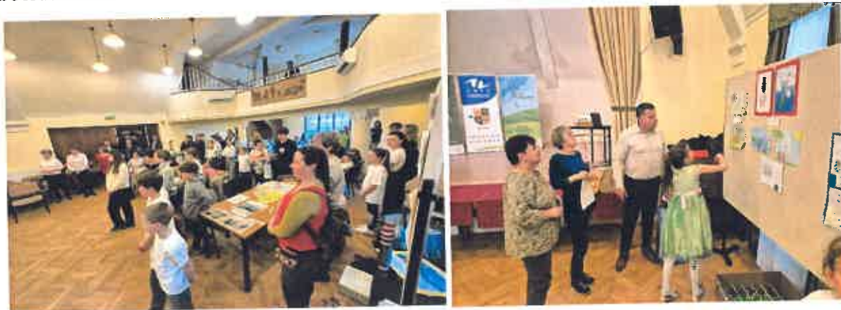
Az Öko-rendezvény Tengelicen 2025. április 15.

A TEIT az idei évben is, mint mindig nagy hangsúlyt fektet a településeinek megrendezésre kerülő rendezvényekre, amelyeken a legtöbb esetben Társulásunk is képviselteti magát, vagy lehetősége szerint elvárja a települések részvételét. Az időszak ilyen eseményei voltak a Paksi-Öko munkacsoport rendezvénye Tengelicen, ahol a TEIT 6 településének növendékei képviselték magukat, kiemelve a környezetvédelem, a hulladékgazdálkodás fontosságát. Ezeket gyakorlati példákkal, és előadásokkal is szemléltetve. A rendezvény véleményünk szerint nagyon fontos szerepet tölt be a térségben a tudatos hulladékgazdálkodási szemlélet kialakításában. Társulásunk aktívan részt vett a rendezvény szervezésében, lebonyolításában, és a díjazások rendelkezésre bocsátásában.