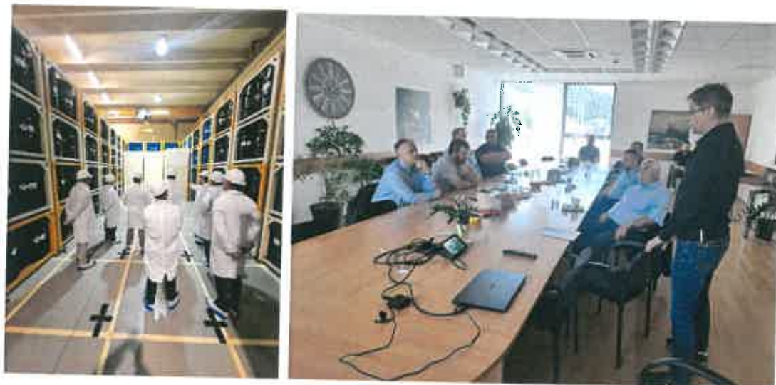
Az ellenőrző csoport tagjai 2025. július 10-én az NRHT-ban

Tárgyévben az Ellenőrző Bizottság a TEIT döntése alapján átszervezésre került Lakossági Ellenőrző Csoporttá. A beszámolási időszakban két látogatás történt radioaktív hulladék tárolóban, illetve nukleáris létesítményben, melyből az első a Kompakt Hulladék Csomagok (KHCS) Nemzeti Radioaktív hulladék-tárolóba (NRHT-ba) történő szállítását érintette, kiegészítve a technológiai épület megtekintésével. Az RHK Kft. bátaapáti telephelyén a csoport betekintést nyert minden rendelkezésre álló beszállítási dokumentációba, szóbeli tájékoztatással kiegészítve.