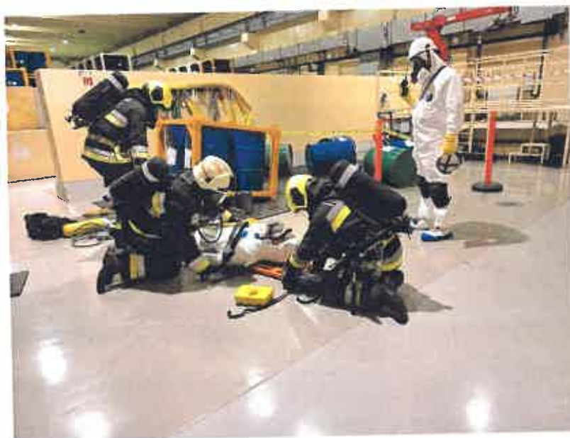
A gyakorlat 2025. november 12-én az NRHT-ban

A beszámolási időszak számunkra fontos eseménye volt telephely látogatás szempontjából az RHK Kft., mint engedélyes által üzemeltetett NRHT telephely teljeskörű Nukleárisbaleset-elhárítási gyakorlatára. A próba folyamán a telephelyen bekövetkezett baleset szimulálása során, személyi sérülést, és radioaktív hulladék kiszóródásával kapcsolatos balesetet imitáltak, amely felszámolására, a megfelelő sugárvédelmi intézkedéseket követően a Tolna Vármegyei Katasztrófavédelem munkatársai valós idejű bevetését gyakorolták. A gyakorlatot a TEIT részéről 4 fő tekinthette meg.