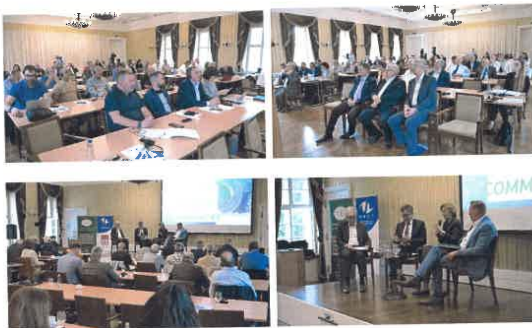
A GMF Közgyűlése és konferenciája 2025. szeptember 24-én Pakson

Az időszak nemzetközi rendezvénye volt a GMF (Nukleáris Létesítmények Körüli Önkormányzatok Európai Szövetsége) közgyűlése és szakmai konferenciája Pakson, amely rendezvényen a TEIT a másik három társulással karöltve házigazdaként fogadta a GMF képviselőket, és véleményünk szerint kimagasló minőségű előadásokkal, panelbeszélgetésekkel megfelelően képviseltük Magyarországot nemzetközi szinten is. A rendezvényen a TEIT részéről minden település képviseltette magát, valamint a szakmai delegációt a konferencia második napján Kalocsán láttuk vendégül.