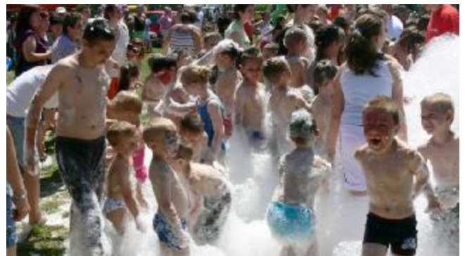
Gyermeknap a sportpályán - 2010. június 6.