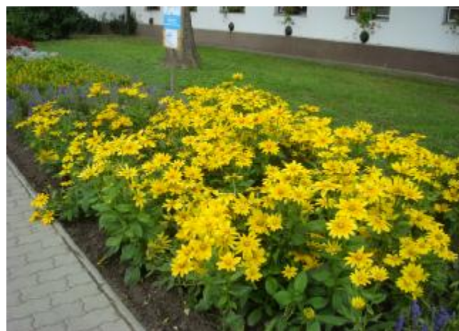
Faluszépítésből jeles - eredményesen pályázott a Faddi Nyugdíjasok Érdekszövetsége