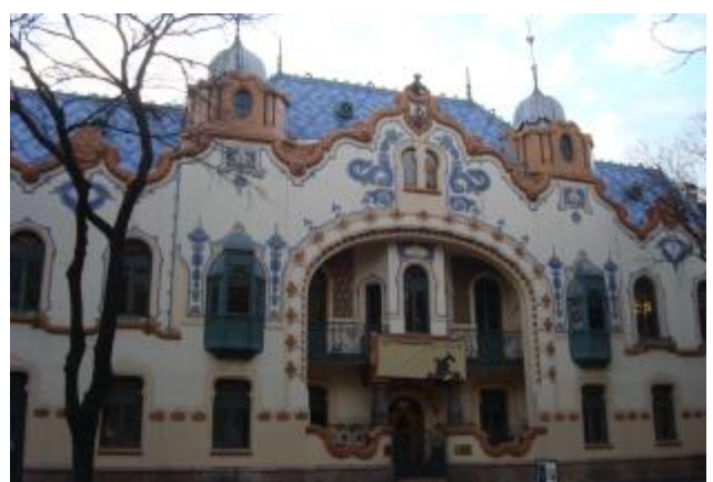
Városnézés és színházlátogatás Szabadkán - 2009. november 14.