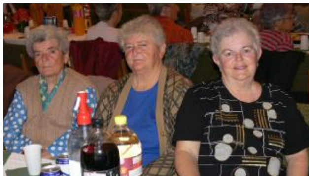
Idősek napja - 2009.