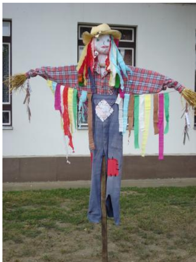
Ez a Pista, seregély nyista...

Madárijesztő-készítő versenyt hirdettünk a szüreti nap alkalmából! Íme, 2 díjazott!