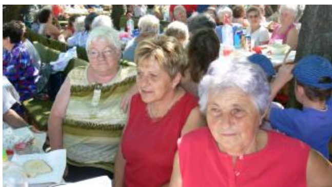
Nyugdíjasok csoportja ebéd után