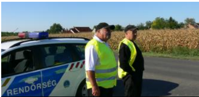
A zarándokok útját biztosították a Templom napján

A Fadd Polgárőr Egyesület a 2009. évben is aktívan részt vett a településen megrendezett eseményeken. A járőrszolgálat keretein túl biztosította az alábbi nagyrendezvényeket is: Dombori Nyári Fesztivál, SporTolna Triatlon verseny, Faddi Falunap, a Domboriban megtartott Megyenap, Templom napja, Szüreti nap.