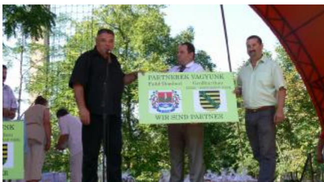
Német vendégeink ajándéka