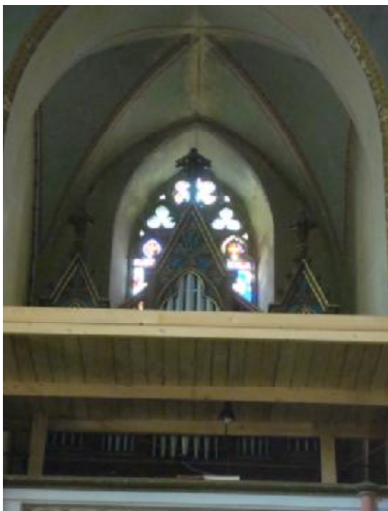
A felújításra váró orgona

Dombori Nyári Fesztivál Fadd-Dombori 2009. július 2-5.