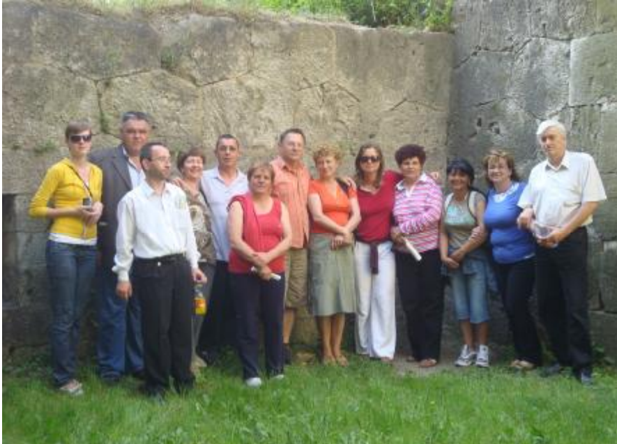
A csoport egy része, a többiek az utolsó sétát kihagyták...

Május elején a Polgári Kör kirándulást szervezett Komáromba, illetve Révkomáromba. Elsődleges úti cél a komáromi erődrendszer megtekintése volt. Az egynapos kirándulásba „csak” az Öregvár, illetve a Monostori Erőd bejárása fért bele, ami jó néhány km-es gyaloglást, szemlélődést, rácsodálkozást jelentett idegenvezetők irányításával.