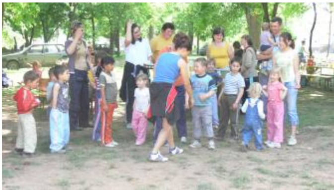
A Föld Napján a Bartal-kertben