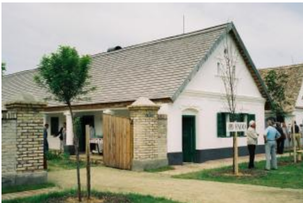
A faddi ház az átadás előtt

2005. június 23-án a szentendrei Szabadtéri Néprajzi Múzeumban