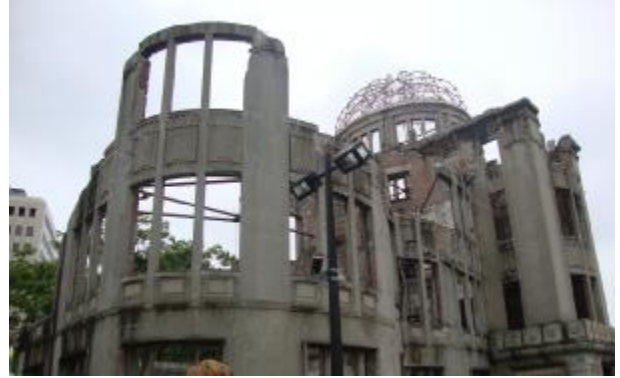
Hirosima – ennyi maradt a lebombázott városból