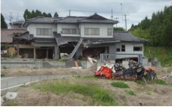
Cunami sújtotta terület