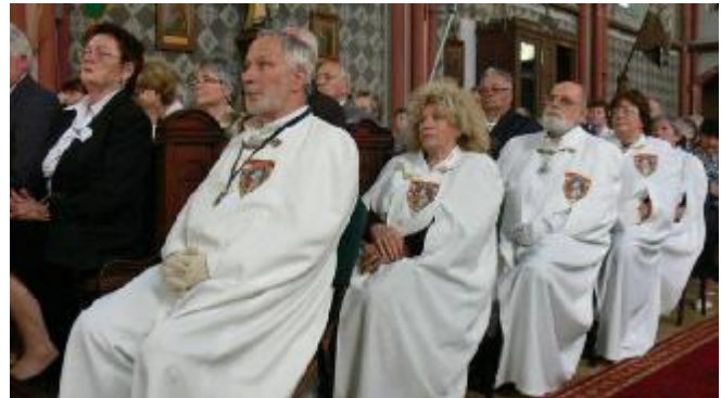
A Szent Korona Lovagrend tagjai idén is elhozták a korona másolatát