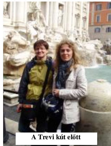
A Trevi kút előtt