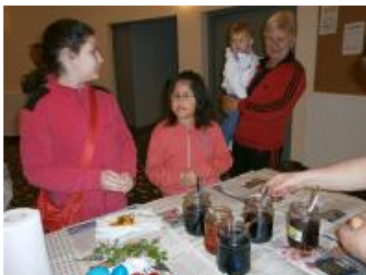
Balra: Húsvéti játékos, jobbra: Figura Ede előadása gyerekeknek a művelődési házban